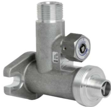
Газонепроницаемое соединение, модель GLTC10 – 3-ходовый комбинированный клапан