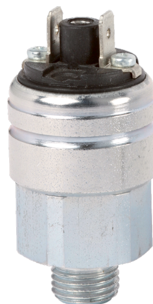
Компактное реле давления, стандартное исполнение, модель PSM06